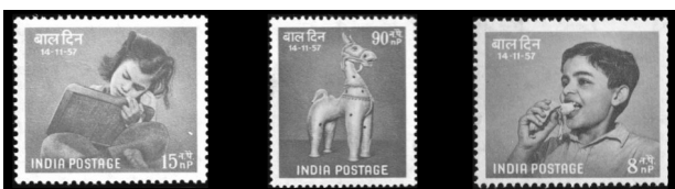
À cette occasion, trois timbres-poste ont été émis. La tradition perdure presque chaque année.

Il faudra attendre 1954 pour voir célébrée, pour la première fois, la journée du 14 novembre comme la « Journée des enfants », quelques années avant d'être officialisée par un décret gouvernemental en 1957.