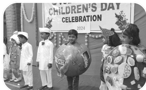
Célébration du « Children's Day au Volontariat